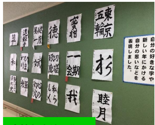
高等部生徒の作品