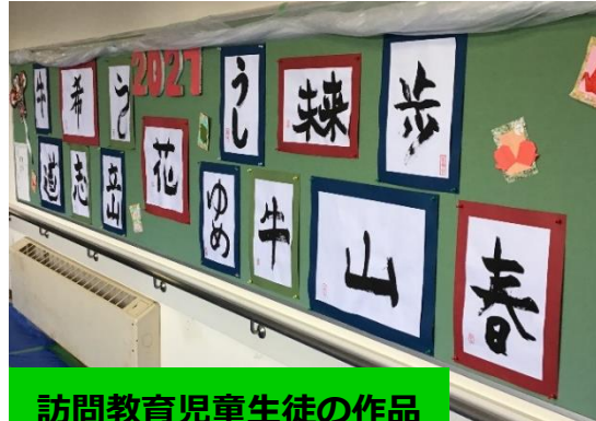
訪問教育児童生徒の作品

廊下には、1月8日に児童生徒の皆さんが書いた、書初めが展示されています。冬休み中に練習した成果や新年に込めた思いが、文字に表れています。