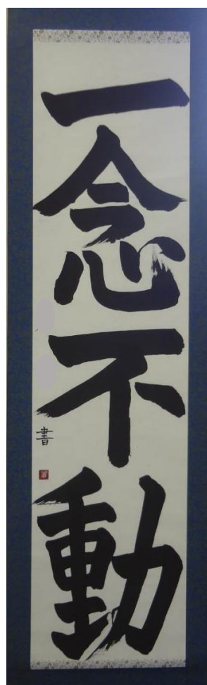
一念不動 高1 J.S