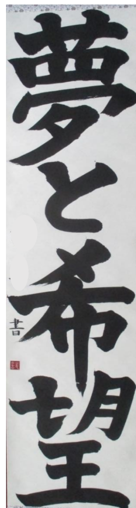
夢と希望 高3 W. S