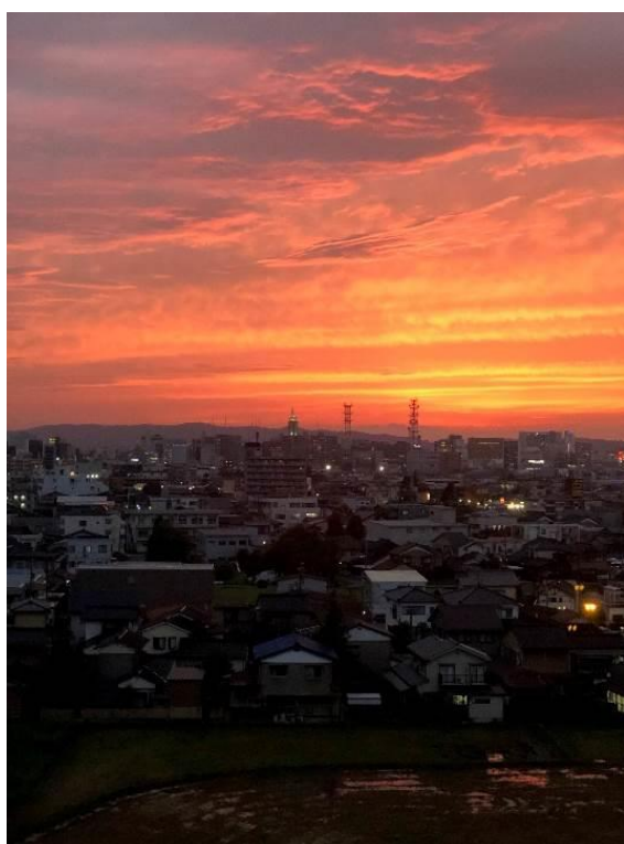
富山シティの夕日 高2 M.M