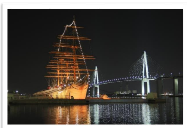
海王丸パーク 高1 M. M