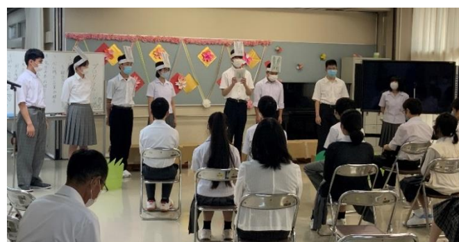
「緑色のうさぎ」の話を上演