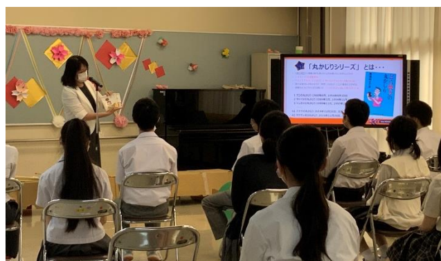
校長先生より「丸かじりシリーズ」の紹介