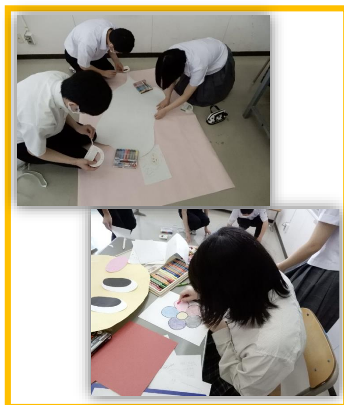
A (ええ) チームの様子