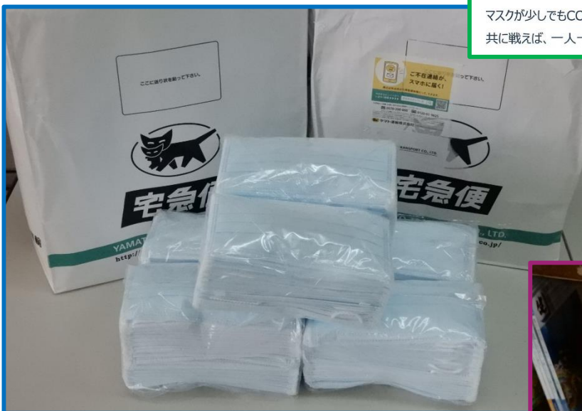
マスク 900 枚寄贈いただきました。

台湾政府及び関係者の方々に感謝申し上げ、有効に活用させていただきます。この度はありがとうございました。